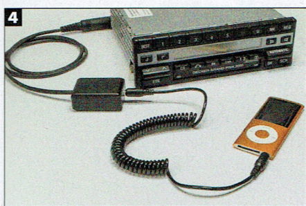
(1) Ein serienmäßiges „Becker Grand Prix“ aus den späten Achtzigern hat keine externen Schnittstellen. (2) Vorbereitet für den Umbau: Das Gerät bekommt eine neue Kabeleinführung. (3) Die passende Buchse ist nachgerüstet. (4) Spielbereit: altes Radio mit neuen Medien